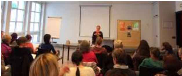
Fachinformationsgespräch am 18. Juni nähere Infos: www.fonds-missbrauch.de

Ermutigen Sie Betroffene zur Antragstellung mit unserer Hilfe oder sprechen Sie uns darauf an. Wir bieten zudem auch Informationsgespräche in sozialen Einrichtungen an.